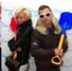
Fashion project Style control